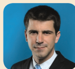
Mathieu Hanotin Conseiller départemental, député de Seine-Saint-Denis